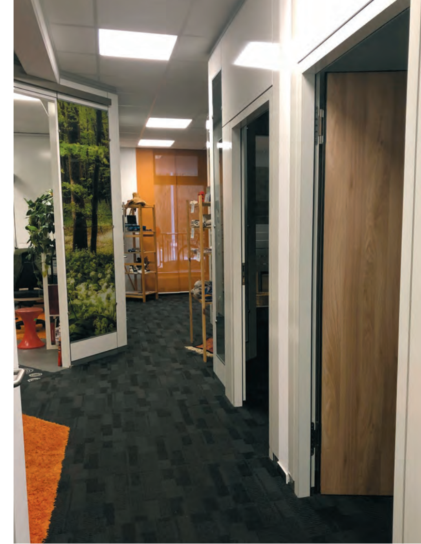
Flur und Gemeinschaftsküche